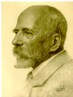
1911 – Foto: Emil Ruf, Zürich