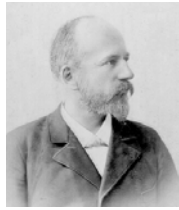
September 1898